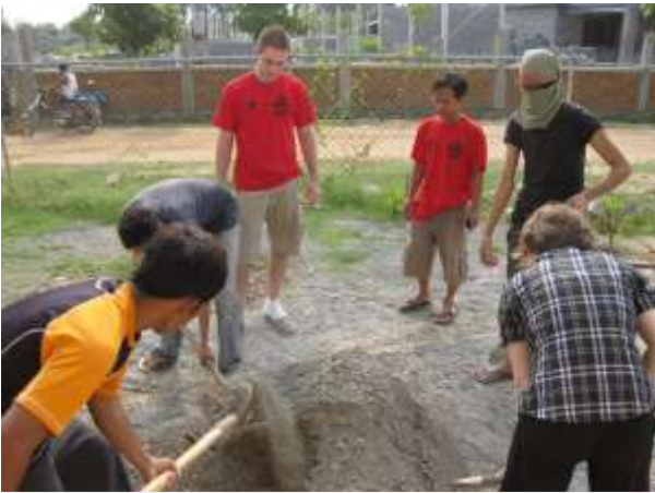
Des actions utiles