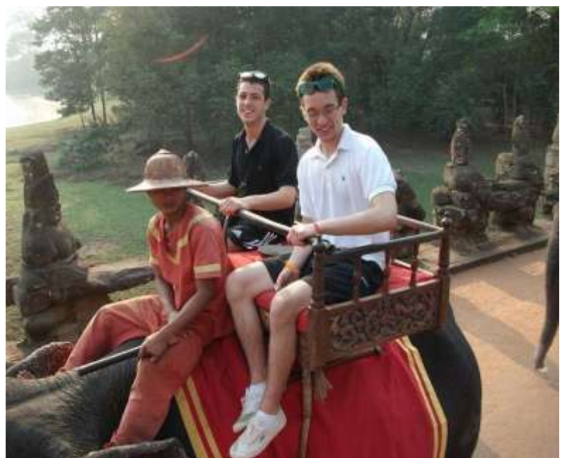
Des moments inoubliables