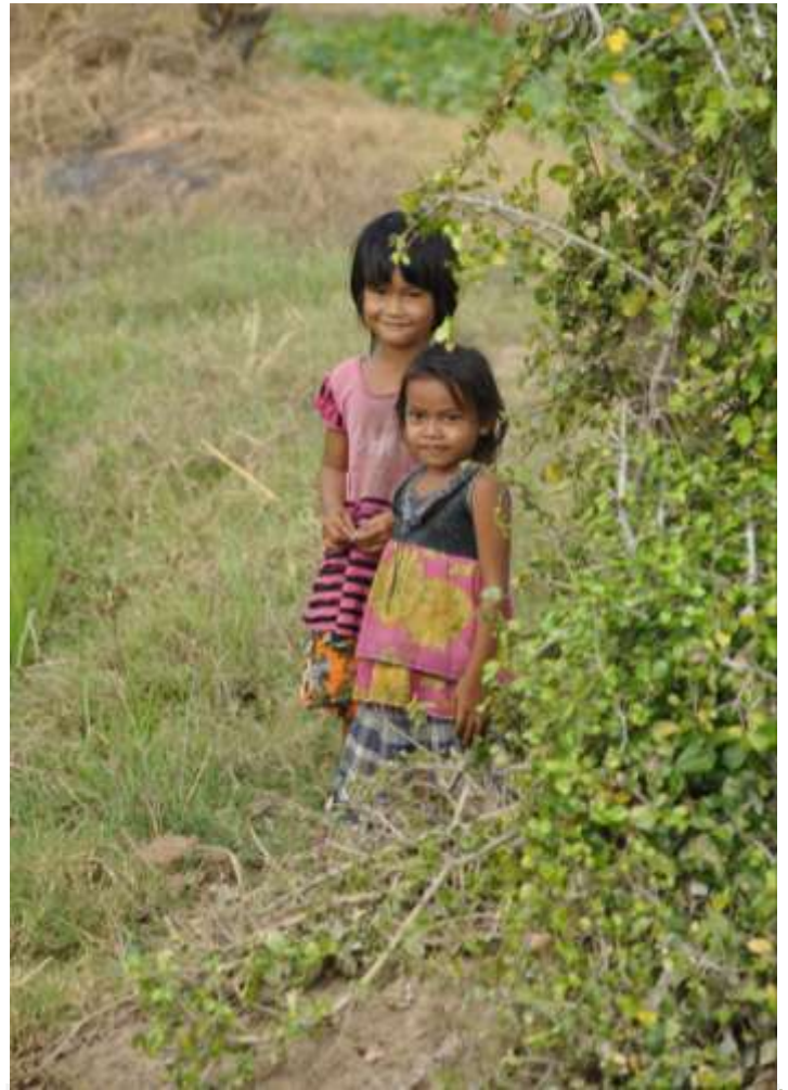
La découverte d'une population