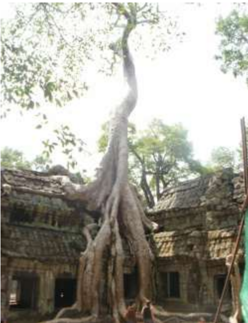
La découverte d'un patrimoine