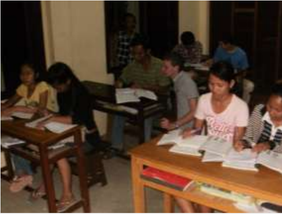
Un contact privilégié